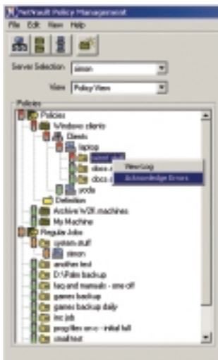
NetVault Policy View showing color coded active policy status.

Um die Administration der Massenspeicher zu vereinfachen, definiert das User Level Access Feature alle Anwender mit einem spezifischen Set aus Rechten, und zwar individuell oder auf Gruppenbasis. Als Beispiel können Datenbank-Administratoren Reports abrufen und Backup-Jobs definieren, während alle anderen Anwender auf die Dateien ihres eigenen